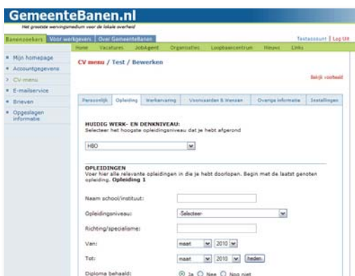
Opleidingsachtergrond in online CV

* Voor een totaal overzicht van de carrièresites: zie pagina 3 "Bereik tijdens Pré-Outplacement"